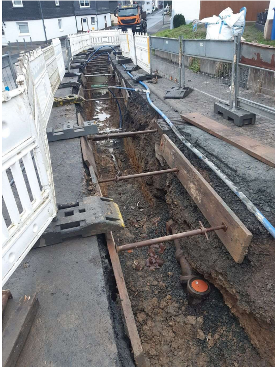
Foto: Leitungsgraben in offener Bauweise