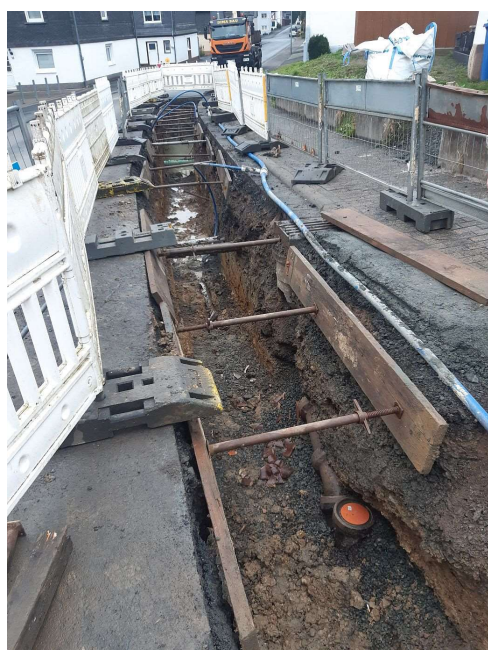
Foto: Leitungsraben in offener Bauweise

Die Auswechslung der Wasserhauptleitung ist auf einer Gesamtlänge von rd. 360 m in offener Bauweise in Duktulguss (GGG) DN 100 vorgesehen und wird künftig in öffentlicher Fläche liegen.