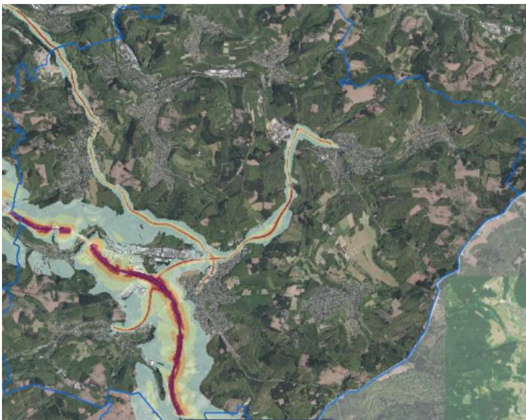
Auszug Lärmkartierung mit Lärmausbreitung nachts

In der 1. Phase der Öffentlichkeitsbeteiligung konnten zudem z.B. Hinweise auf ein konkretes (lokales) Lärmproblem gegeben oder konkrete Vorschläge zur Minderung einer Lärmbelastung